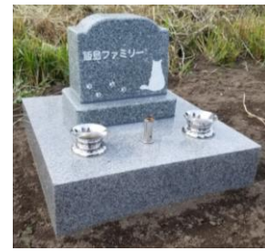
ネコちゃんのお墓

ペットは家族の一員です。長年、一緒に生活していると、当たり前存在になつてきます。お客様は、生活を共にしたネコちゃんのお墓を作って供養したいとご来社されました。家族全員がネコちゃんを可愛がっており、人生の節目の時や落ち込んでいる時など、気持ち