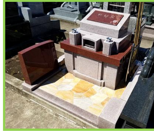
インド産高級赤御影石とピンク色の石が優しい色合いの印象を受けます。黄色の乱張りがより墓石を引き立たせます。