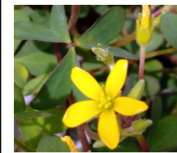
カタバミ (適正多年草)

放っておいたらあっという間に草だらけ。雑草は繁殖力が強く、しぶとく長生きします。堅い土やアスファルトのすき間など、芽吹く強健な雑草。人に踏まれても少々事では倒れない強敵で強者。