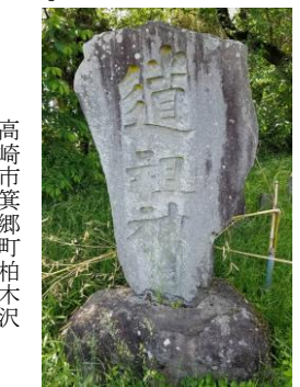
高崎市美郷町柏木沢

私も石にアマビエを彫刻してみました。多くの人に目に触れることにより、新型コロナウイルスが終息するように祈るばかりです。