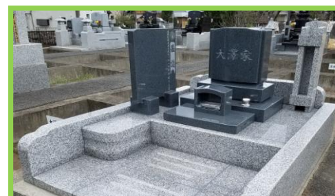
グレー系御影石と白御影石の落ち着いた雰囲気洋型墓石です。