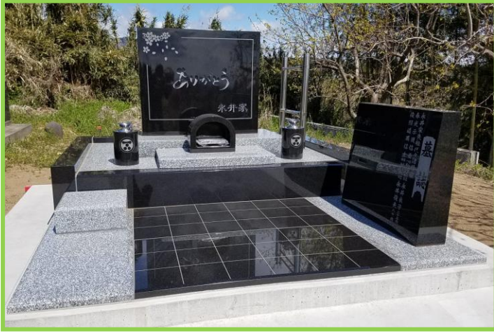
文字や形にこだわったデザイン墓。来た人に「ありがとう」のポストカードを届けるようにと想いを込めて。