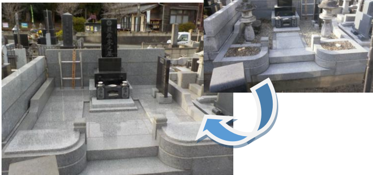
墓石は既存の石をクリーニングし復元。お参りしやすい様、納骨は岡カロート式に、参道はバリアフリーに。