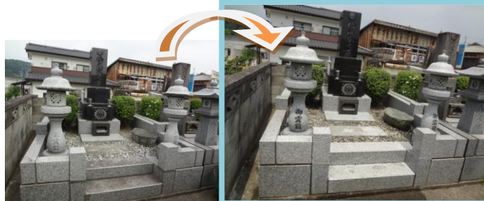
御影石についた黒いアクを専用洗剤で取り除き、きれいに。お墓全体のクリーニングを行い、文字の色を入れ直し、一段と明るい雰囲気になりました。黒御影石にもツヤが蘇りました。