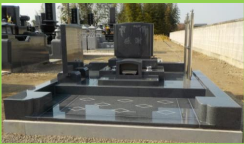
グレー系の御影石で統一しました。清楚で広々と感じます。お参りしやすいバリアフリー型です。