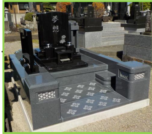
寿陵墓です。家族代々で使える調和のとれたデザインです。