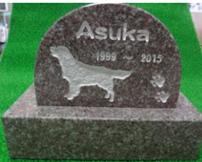
ワンちゃんのお墓

和らぎとても癒されて助けられたと語ってくれました。ペットのお墓を作る方は、一緒に生きてきた証を残したいとの想いがあり、お墓を建て、名前を刻み、ずっと忘れる事なく供養されます。中里では、ペットのお墓を建てるお手伝いを承っております。