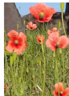
ナガミヒナゲシ(長実雛罌粟) <ケシ科>

道端や公園、庭でもよく見かける初夏の風物詩とし定着。全体的に毛が生えて、茎を切ると黄色い液体が出ます。高さ 20~60cm、葉が羽状に裂けて、花は紅色の4弁花。周囲の植物の成長を阻害する成分を放出します。一つの花から数百・数千単位の種子が出来ます。劣悪な環境であっても短い草丈のまま開花し猛烈に繁殖し、特定外来生物に匹敵する厄介な雑草です。