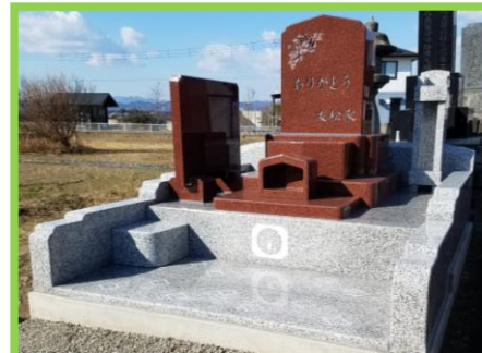
インド産高級赤御影石。花模様の彫刻と「ありがとう」を刻む。