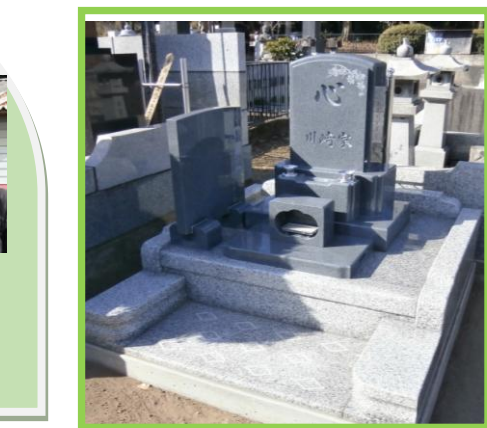
「心」を込めてお墓参り。亡き人に逢いに来ます。