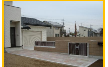
前橋市内 外構・石貼り工事