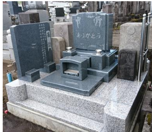
「ありがとう」と「ふじの花模様」を彫刻。 先祖様の墓石と一緒に祀りました。

供養の形 完成した御墓所には一つ一つ思いが込められています。紹介させていただきます。