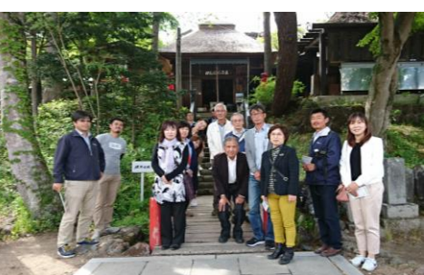
鎌原観音堂前にて

音堂へ行ってきました。一七八三年・今から二四年前に起きた浅間山大噴火で無くなった場所です。鎌原村があった場所です。 大噴火により大規模な火砕流が流れ鎌原村はすべてのみこまれてしまいました。人口約600人中93人が村の高台にあった鎌原観音堂に逃げ、助かったそうです。火砕流は江戸にまで流れ最終的に約千五百名の犠牲者を出したといわれています。当時の村は今の地上から約5m程下にあつたそうです。鎌原観音堂周辺は、昭和54年から発掘