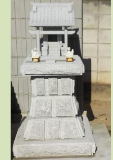
鳥居付 御影石製 高崎市 梅山邸