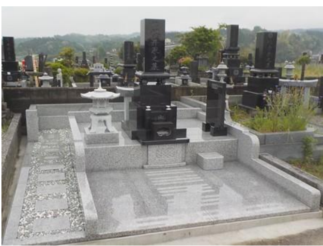
広い御墓所のリフォーム 上質な黒御影石の墓石と外柵の石をきれいにクリーニングをして復元。上品で落ち着いた雰囲気の御墓所となりました。ゆったりとお参りできます。