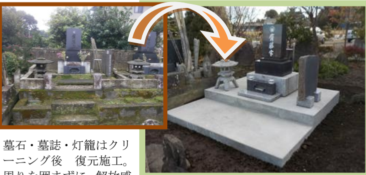
墓石・墓誌・灯籠はクリーニング後 復元施工。周りを囲まらずに、解放感あるお参りしやすい御墓所になりました。