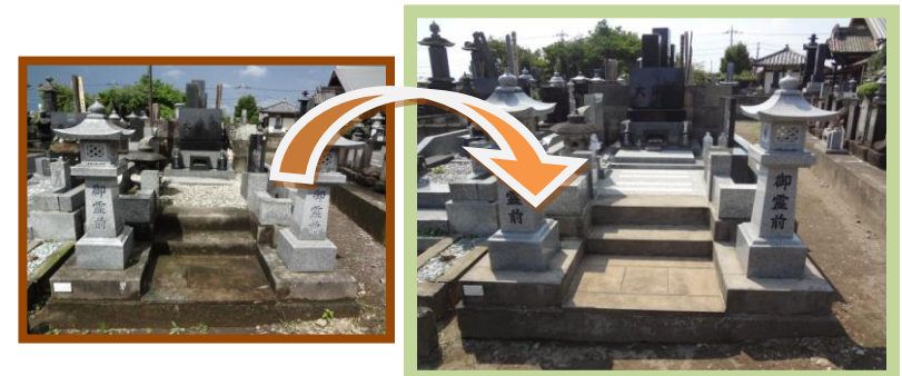
敷き砂利を取り除き御影石を貼り、お手入れしやすくなりました。お墓全体のクリーニングを行い、文字の色を入れ直し、一段と明るい雰囲気になりました。

コンクリートブロック製の外柵を交換。墓石は汚れを取り除き綺麗に仕上げ復元。お参りしやすくなりました。