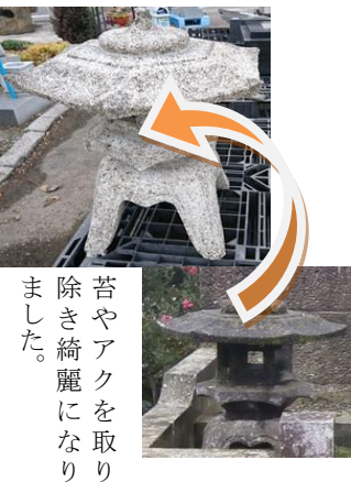
苔やアクを取り除き綺麗になりました。